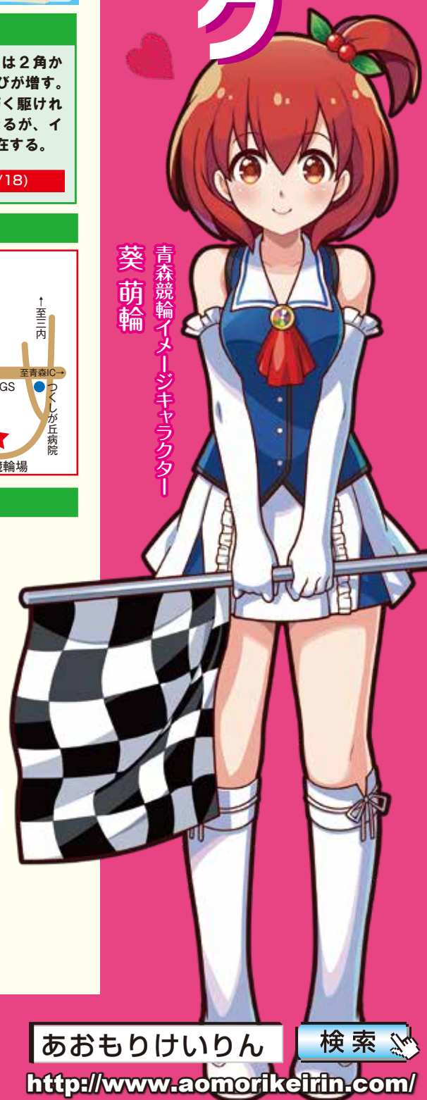
青森競輪イメージキャラクター 葵萌輪